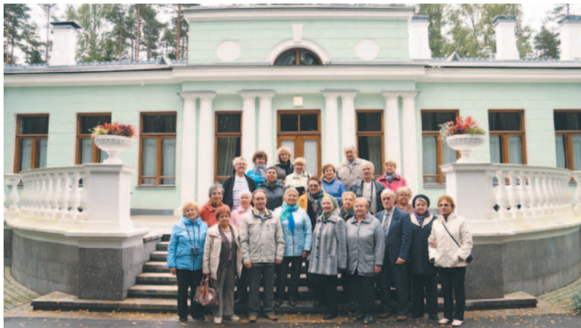
Участники экскурсии на фоне музея

Указ императрицы Екатерины II от 28 мая 1770 года сообщал о возведении находившегося с XVI века в государевом владении дворцового села Валдай в статус города. Это способствовало развитию его, строились колокольные заводы, женский монастырь Тихона Заводского, административные здания, школа им. В.П. Острогорского, кото-