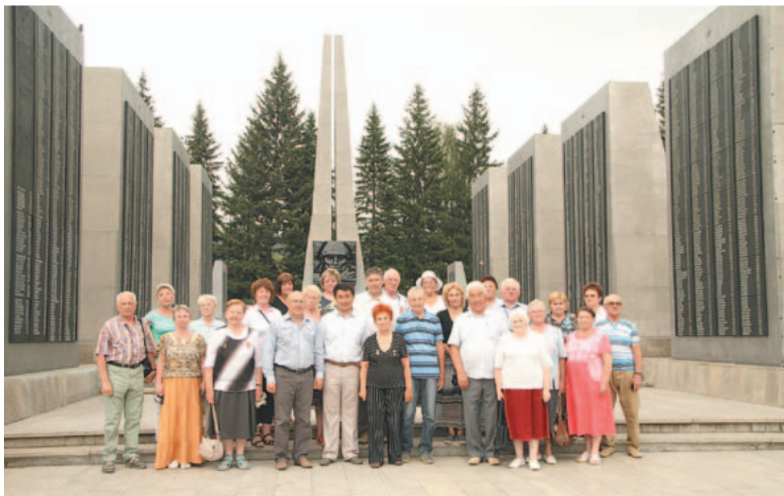
Участники путешествия возложили цветы к Мемориалу Славы

Третий день — это посещение острова Патмос на реке