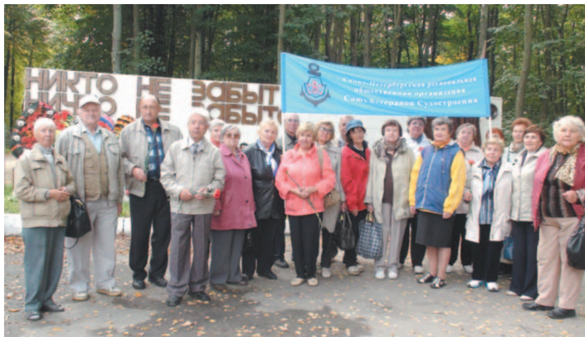
Возложение цветов в годовщину Великой Победы 9 мая 2015 г.

Только Совет составляет 30 человек, а помещение 18 кв.м, где нет условий для работы. Мы неоднократно поднимали этот вопрос, но пока он не решен.