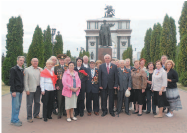
Делегация ветеранов в Курске

Для отдыха ветеранов организуются многочисленные мероприятия на которых они общаются,