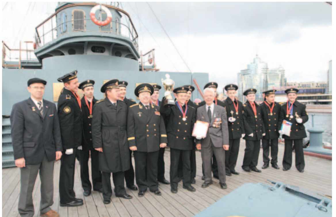
Урок мужества на «Авроре» проводит капитан Гранга Герой России А.Г. Зайцев

Ветераны судостроения провели в школах и учебных центрах районов серию бесед со школьниками по судостроению. К.А.Никитин были разработаны тезисы бесед, а мною разработан буклет «Судостроение Санкт-Петербурга» с указанием всех учебных судостроительных заведений города. Буклет в количестве 1000 экземпляров был роздан школьникам.