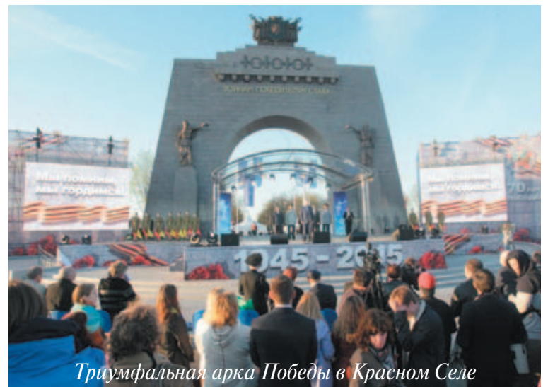
Триумфальная арка Победы в Красном Селе