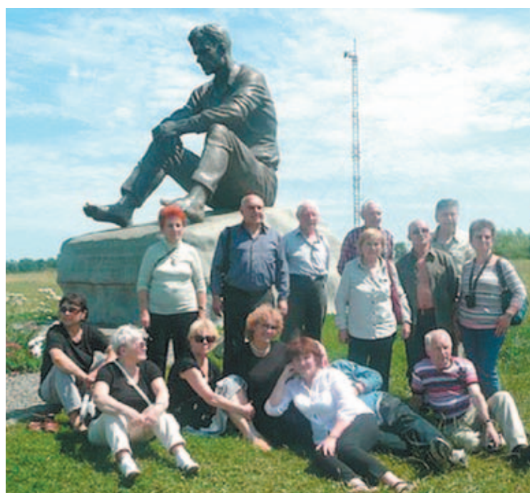
У памятника Василию Шукшину