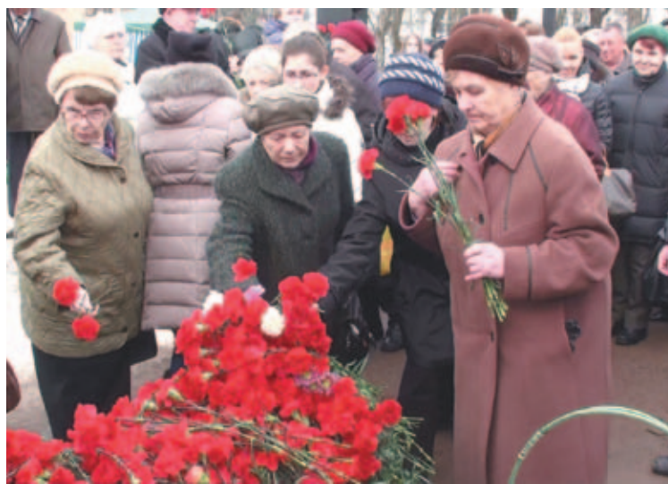
Возложение цветов к памятнику малолетним узникам фашистских концлагерей.

По второму вопросу Г.Л. Карасева отметила, что самым большим вопросом для узников остается медицинское обслуживание в поликлиниках. Анализ проведения диспансеризации показал, что ее прошли только 7% бывших малолетних узников. Есть жалобы на сроки ожидания приема специалистов, особенно кардиологов и