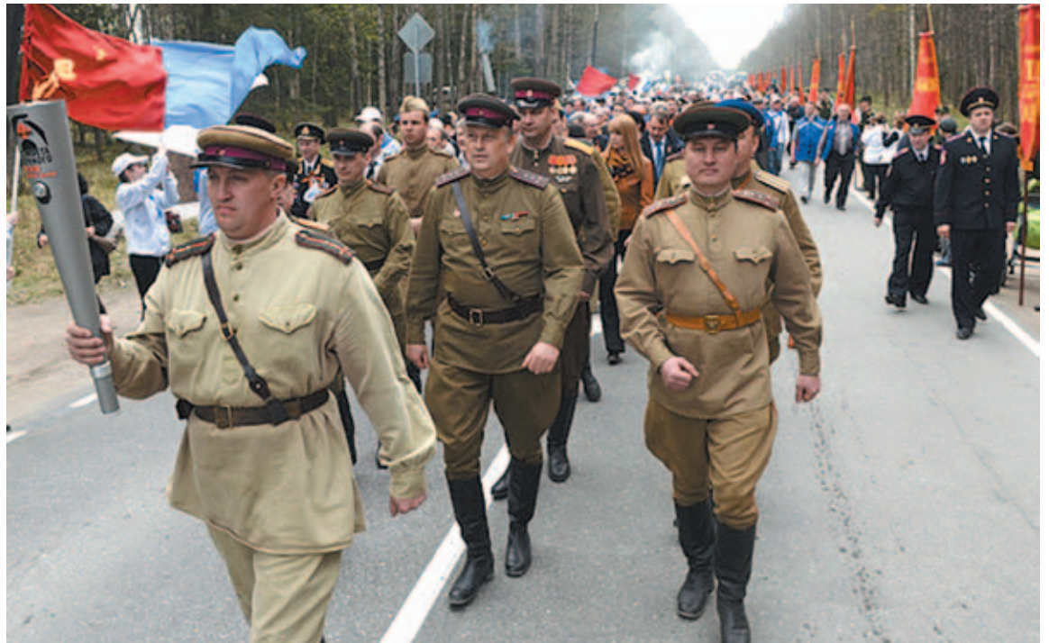
Огонь памяти из 45 городов воинской славы России доставлен на Дорогу жизни

Мы имеем тесные деловые, дружеские контакты с ветеранскими организациями