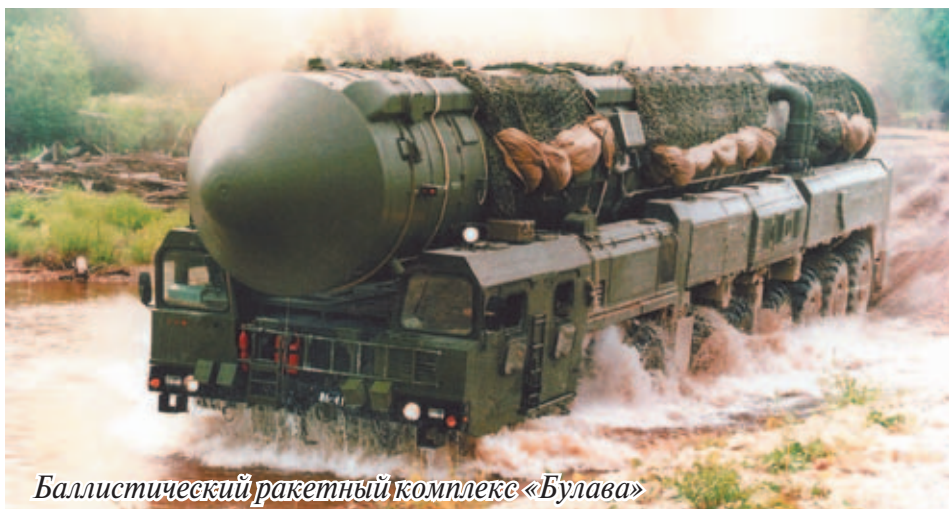
Баллистический ракетный комплекс «Булава»

В 2015 году в ЗВО проведено более 40 командно-штабных и 90 тактических учений в звене дивизия-бригада-полк, которые показали возросший уровень оперативной и боевой подготовки личного состава.