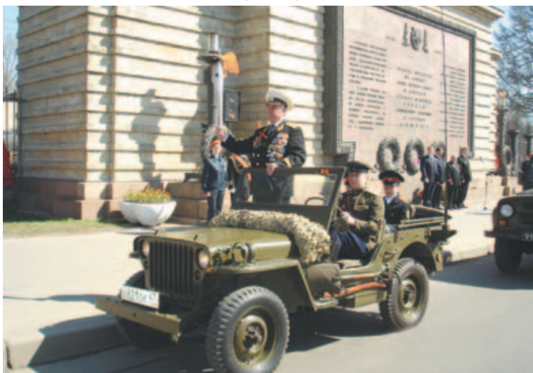
Вечный огонь доставлен в город воинской славы Колпино

Ветеранские организации района обеспечены помещениями для работы и приема граждан. Благодаря руководству района ветераны получили возможность улучшить свои бытовые условия. Все ветеранские организации, работающие